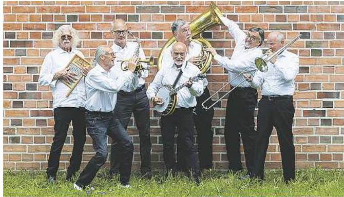
Jazz-O-Maniacs spielt auf.

Bei der Veranstaltung tritt die Band Jazz-O-Maniacs auf. Sie besteht seit 1966 und hat sich dem klassischen Jazz, dem „Hot Jazz“ der Zwanziger- und Dreißigerjahre, verschrieben. Die Musiker spielen eine Mischung aus Originaladaptionen, eigenen