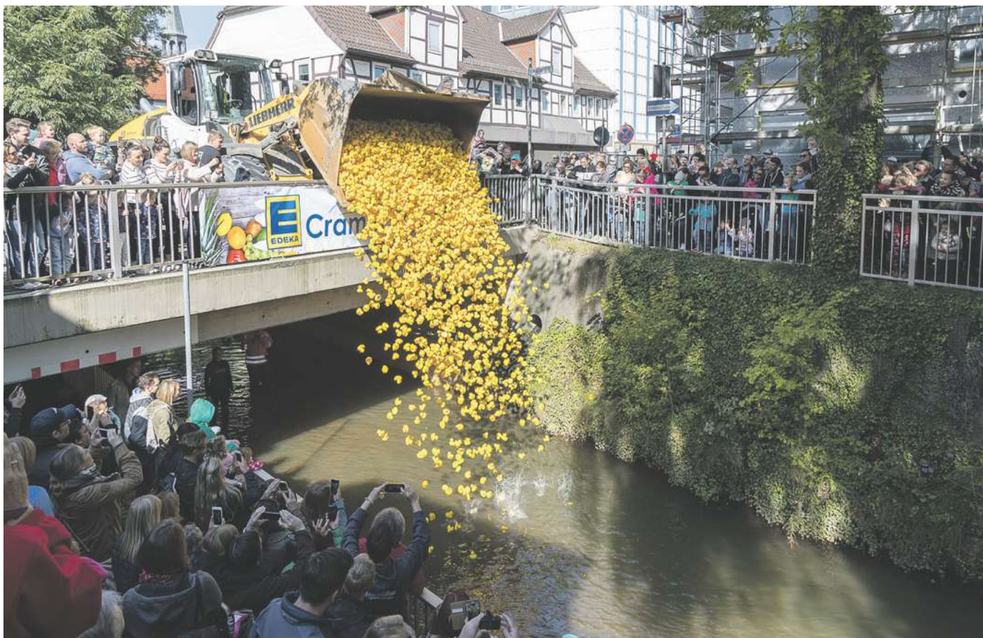
Höhepunkt des nächsten Pferde- und Hobbytiermarktes ist das Entenrennen auf der Aue.

Pferde- und Hobbytiermarkt am 20. Mai mit einem bunten Programm