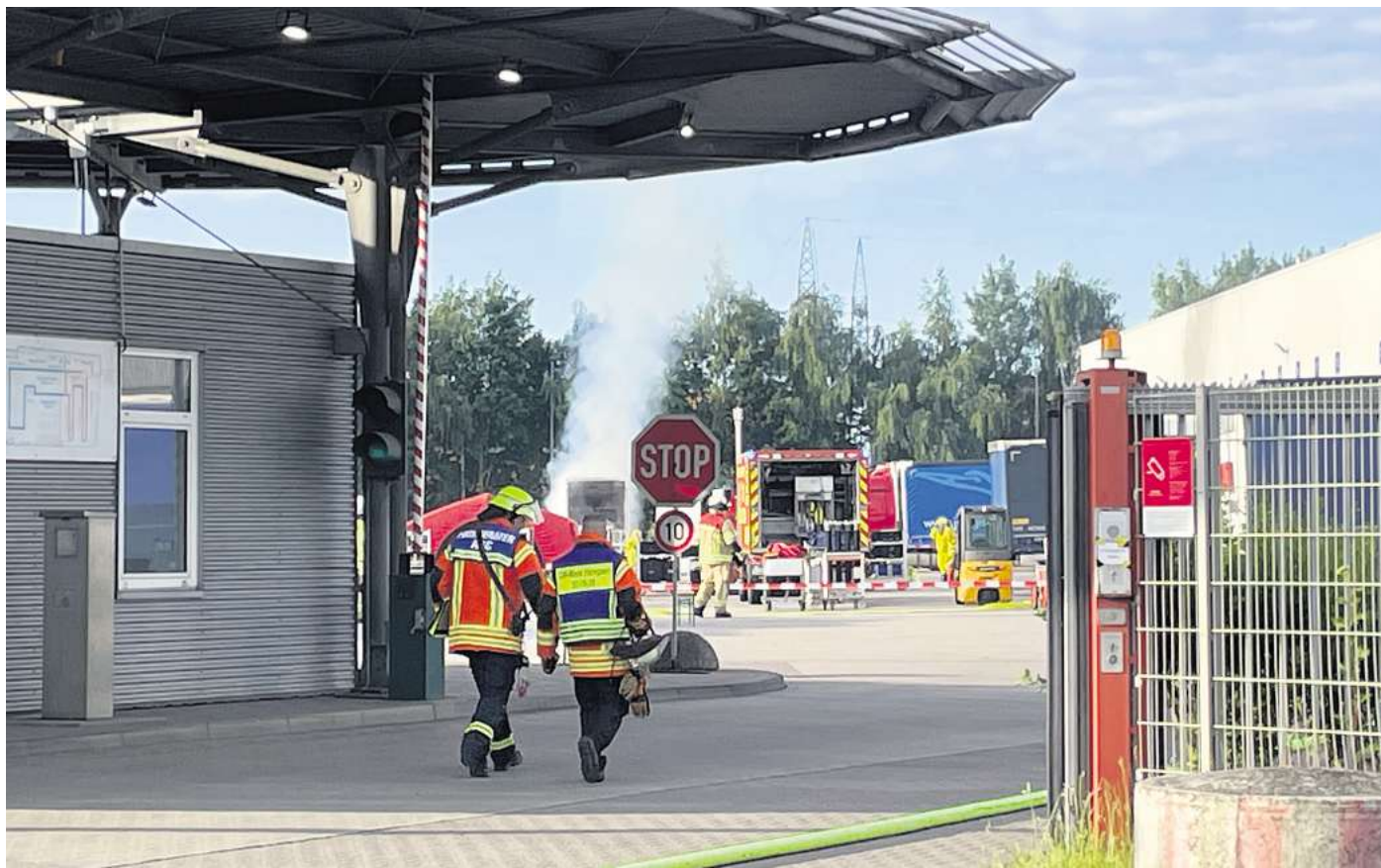
Blick auf die Einsatzstelle mit der qualmenden Wechselbrücke.

Die ersten Einsatzkräfte vor Ort bestätigten das Lagebild. Zudem wurde festgestellt, dass die austretende Flüssigkeit nach dem Auftreffen auf dem Boden anfing, Blasen zu bilden. Daraufhin wurde durch den Einsatzleiter eine Alarmstufenerhöhung auf ABC 1 veranlasst, so dass weitere Spezialkräfte zur Einsatzstelle alarmiert wurden. Zeitgleich wurde die Lagehalle, an der die Wechselbrücke stand, geräumt und das Areal weitläufig abgesperrt. Anhand der Ladepapiere konnten einige Chemische Stoffe ermittelt werden, die in der Wechselbrücke transportiert wurden, jedoch passte keiner der Stoffe zu dem vorgefundenen Lagebild. Während ein Trupp, ausgerüstet mit Chemikalienschutzanzügen die austretende Flüssigkeit mit einem Chemikalienbinder abstreute, wurde mittels einer eingesetzten Drohne eine Wärmeentwicklung innerhalb der Wechselbrücke festgestellt. Daraufhin wurde die Wechselbrücke mit Hilfe eines Fahrzeugs der Spedition vom Gebäude entfernt und der Einsatzleiter erhöhte die Alarmstufe auf ABC 2, womit der komplette Gefahrgutzug der Region Hannover Ost nach Lehrte beordert wurde. Nach dem Öffnen der Brücke wurde die weiße Rauchentwicklung intensiver und kurze Zeit später war auch ein erster Flammenschein sichtbar. Daraufhin wurde ein intensiver Löscheinsatz durchgeführt, bei dem neben