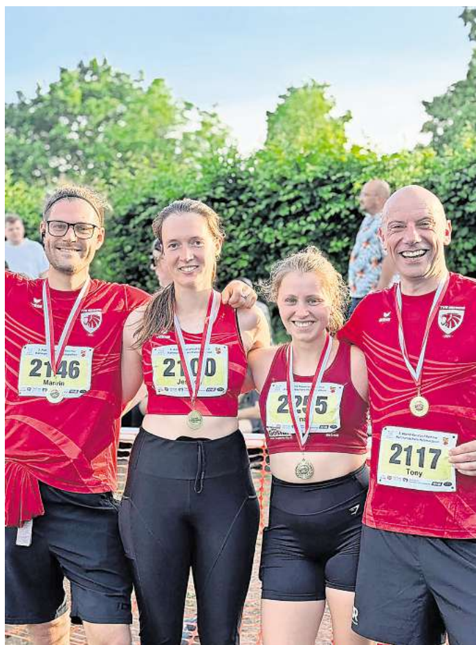
Mit einer Rekordbeteiligung hat der TVE Sehnde am Abend-Kanallauf in Rethmar teilgenommen.