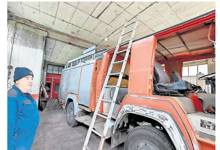
Die salzige Luft hinterließ Spuren: Ein Mechaniker auf Samos reparierte die Karosserie, Elektronik, Türen und Rollos.