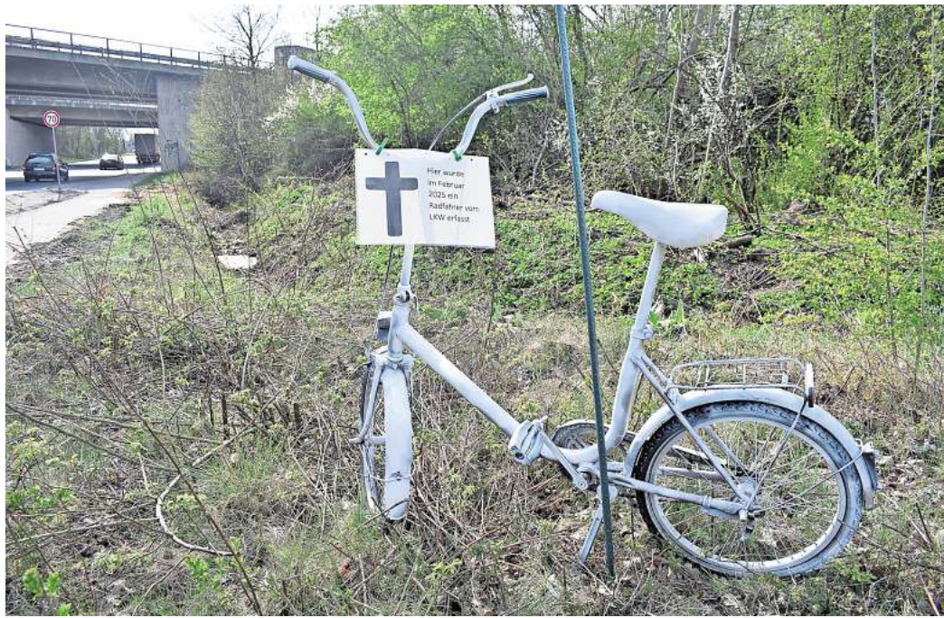
Es darf bleiben: Das Geisterrad gefährdet nach Einschätzung der Lehrter Stadtverwaltung nicht den Verkehr.

Auch auf Schulwegen kam es zu Unfällen. Zwei Kinder wur-