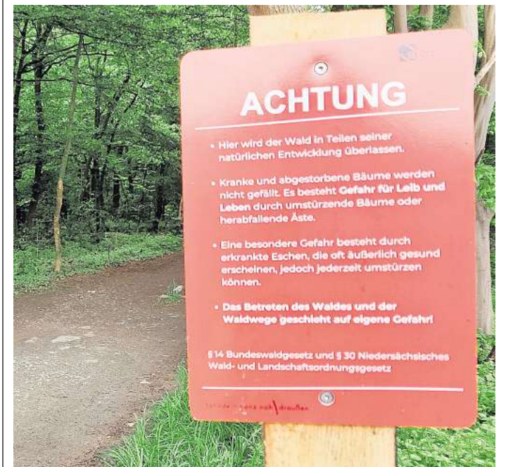
Die Stadt hat neue Hinweisschilder aufgestellt.

Trotzdem erlaubt die Stadt nun wieder das Betreten des Waldes – allerdings auf eigene Gefahr. Neue Hinweisschilder informieren über die Situation und weisen auf die Risiken hin. Gerade Eschen sei nicht immer anzusehen, dass sie erkrankt seien und umstürzen könnten. Äußerlich würden sie oft gesund erscheinen, warnt die Stadt. Sie bittet weiterhin darum, beim Aufenthalt im Wald besondere Vorsicht walten zu lassen und die aufgestellten Hinweise zu beachten.