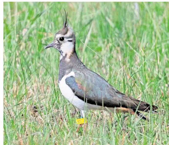
Ein Kiebitz läuft bei Harthausen durch das hohe Gras einer Wiese. Mitarbeiter eines Kiebitzschutzprojektes kümmern sich hier intensiv um die Wiederansiedlung einer größeren Population der Vögel, wobei auch Tiere ausgewildert werden. Der Kiebitz ist etwa so groß wie eine Taube und hat einen Federkamm auf dem Kopf.

Die Kiebitzinseln sind Bestandteil im Biodiversitätsprogramm der Region Hannover,