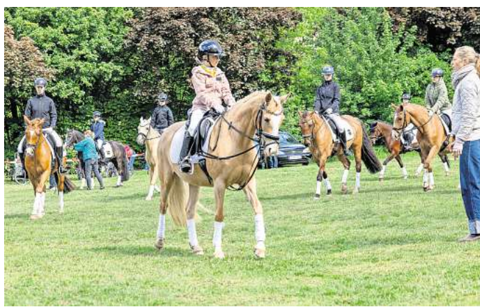
Die Niedersächsische Reitponyquadrille zeigt ihr Können.