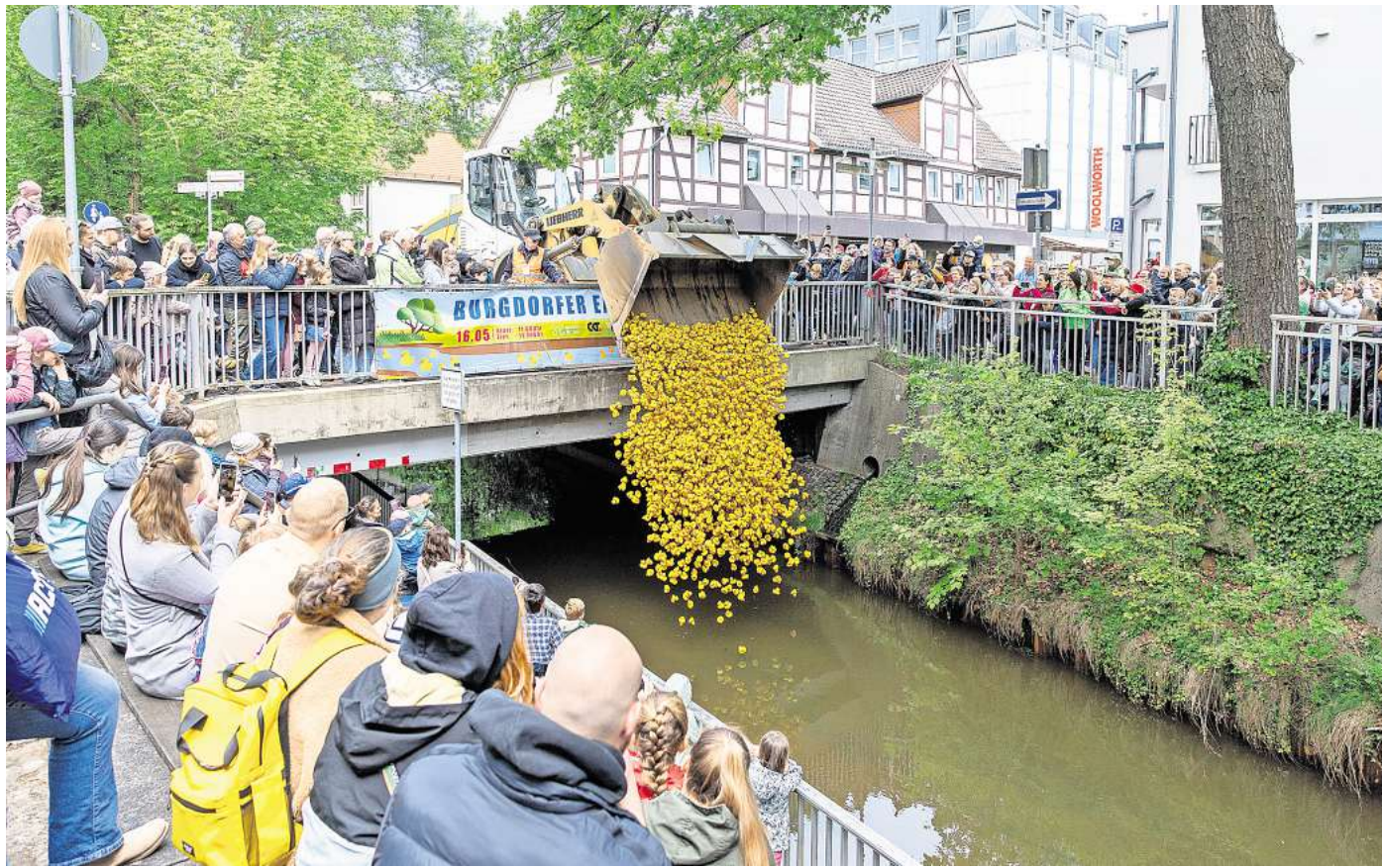
Das Entenrennen auf der Aue startet an der Brücke auf der Poststraße.

Bereits in den frühen Morgenstunden zog das 13. Burgdorfer Oldtimer-Treffen auf dem Pferdemarktgelände zahlreiche Liebhaber historischer Fahrzeuge an. Ob nostalgische Automobile, Motorräder oder seltene Sammlerstücke – die historischen Fahrzeuge weckten bei vielen Besu-