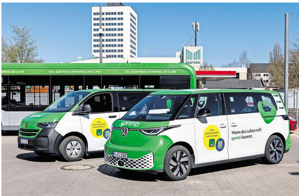
Sprinti wird elektrischer und regionaler: 20 ID.Buzz aus dem VW-Werk in Stücken erweitern ab sofort den Fuhrpark.