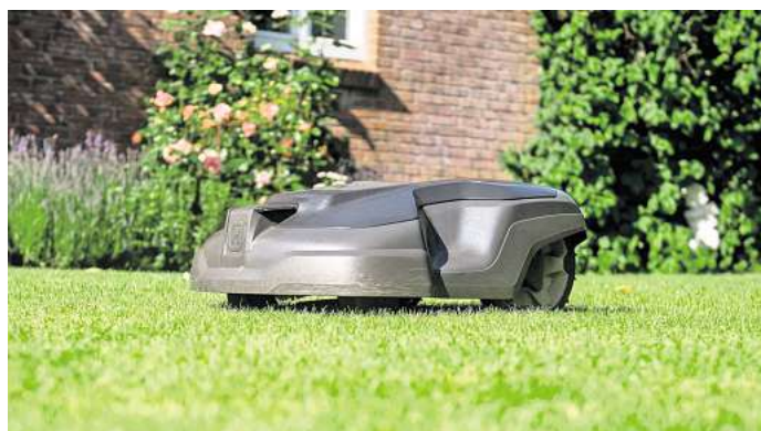
Mähroboter können für kleine Tiere gefährlich sein - daher nur mit Vorsicht und unter Aufsicht einsetzen.

Wichtig: Mit dem Baum kommt auch ein Pfahl in die Erde, an dem das Gehölz zum Schutz vor Windschäden mit einem Strick festgebunden wird. Der Pfahl sollte 10 bis 15 Zentimeter Abstand zum Stamm haben und nach Westen ausgerichtet sein. Der Landesverband Schleswig-Holstein des Bundes für Umwelt und Naturschutz Deutschland (BUND) empfiehlt außerdem, einen Pflanzkorb aus Kaninchen- oder Draht mit ins Pflanzloch zu setzen, um die Wurzeln vor Wühlmäusen zu schützen. (DPA)