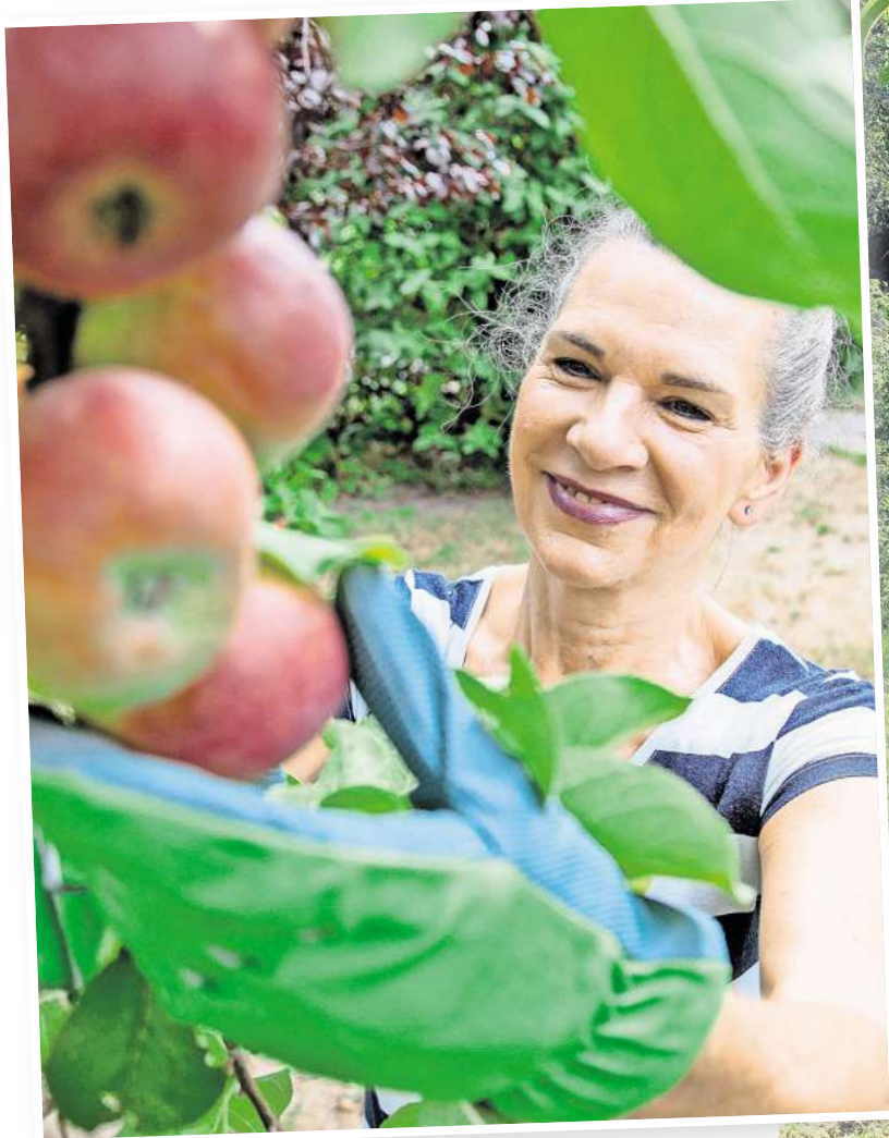
Nicht nur im Herbst: Auch im Frühjahr lassen sich Obstbäume erfolgreich pflanzen.