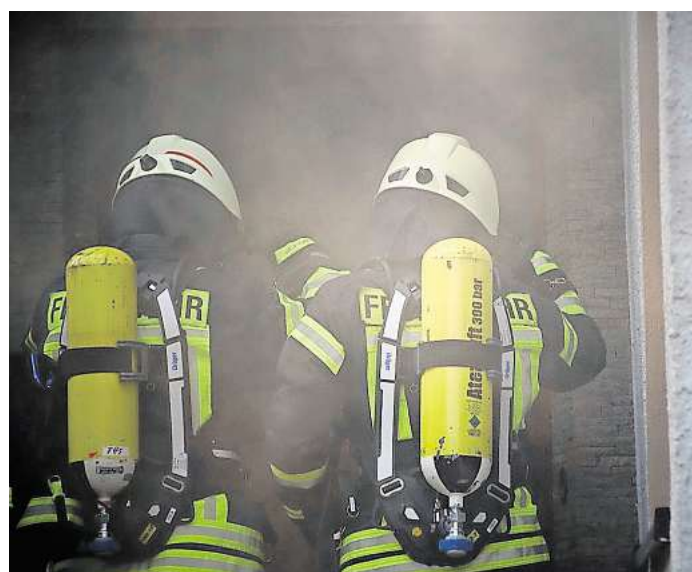
Beispiel für einen Löschangriff mit Atemschutz bei starker Verrau- chung.

An der Einsatzstelle ging ein Trupp unter schwerem Atemschutz in den betroffenen Raum vor, die Person konnte zwischenzeitlich durch JVA-Mitarbeiter aus dem Raum gerettet werden. Der Brand wurde zügig gelöscht und anschließend umfassende Belüftungsmaßnahmen durchgeführt, um Rauch und Schadstoffe aus dem Gebäude zu entfernen. Im Einsatz befanden sich die Ortsfeuerwehren Sehnde und Ilten sowie der Rettungsdienst.