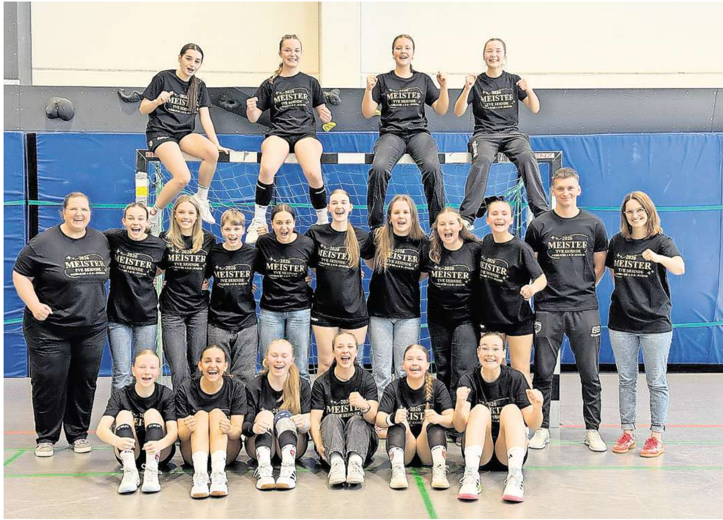
Krönender Saisonabschluss: Das Team der weiblichen A-Jugend Handball.

TVE-Handball, weibliche A-Jugend sichert sich Meisterschaft