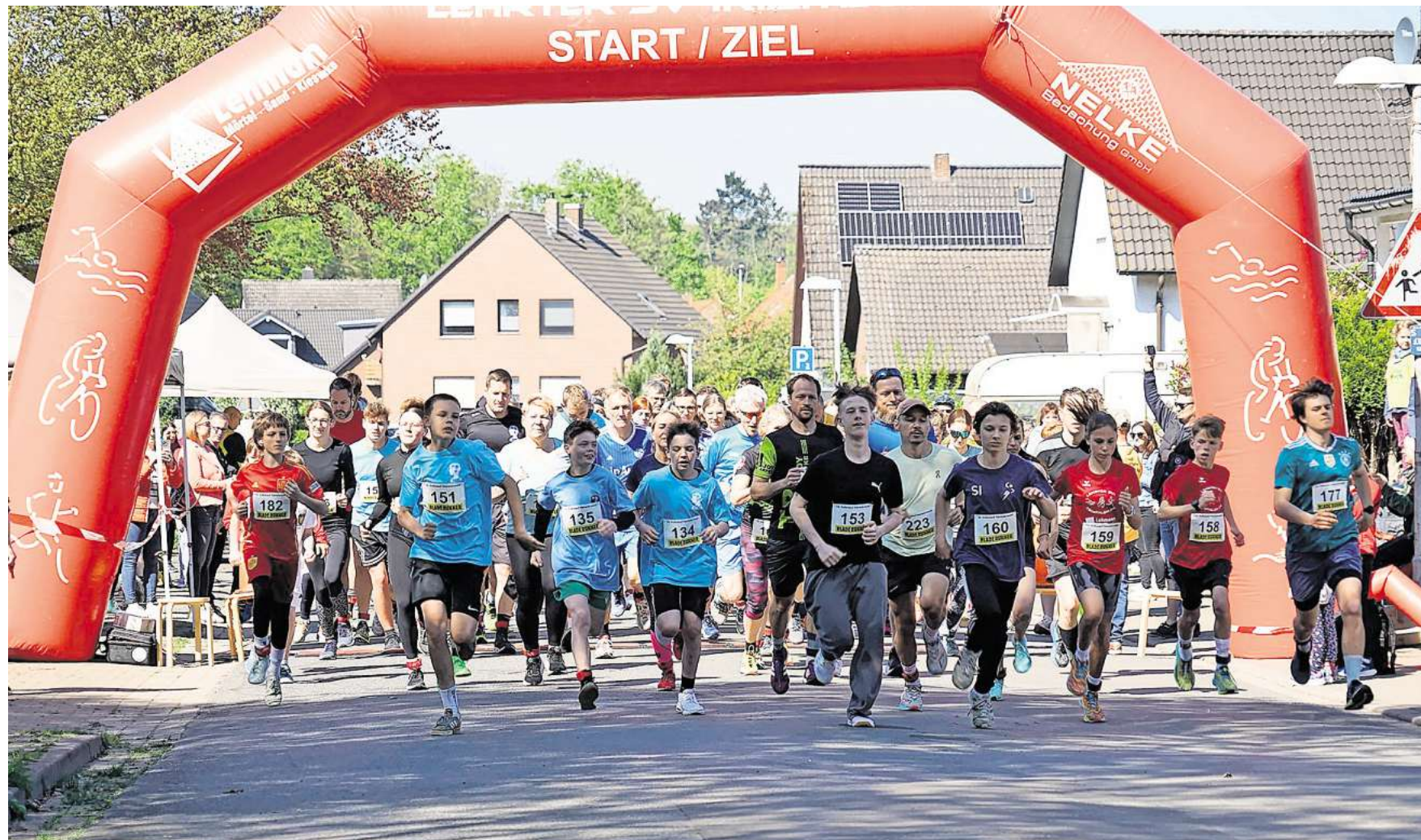
Der Volkslauf in Hämelerwald empfiehlt sich mit guten Wettkampfbedingungen.

„19. Volkslauf Hämelerwald“ am Sonntag, 26. April, auf Rundkursen an der Grundschule