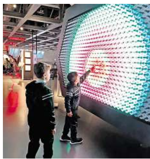
Mit Spenden ermöglicht: Kinderschutzbund realisiert Ausflug für Ferienkinder in das Phaeno in Wolfsburg.

LEHRTE. Mit drei unterschiedlichen Projekten hat die Stadtverwaltung zusammen mit Unternehmen und sozialen Einrichtungen im vorigen Jahr den Aufschlag für das Konzept „Wege finden - ein Social Day in Lehrte“ gemacht, bei dem Mitarbeiter aus Lehrter Unternehmen soziale Projekte unterstützen können. Es sollten Begegnungen entstehen, die verbinden und die für die gesellschaftliche Verantwortung sensibilisieren.