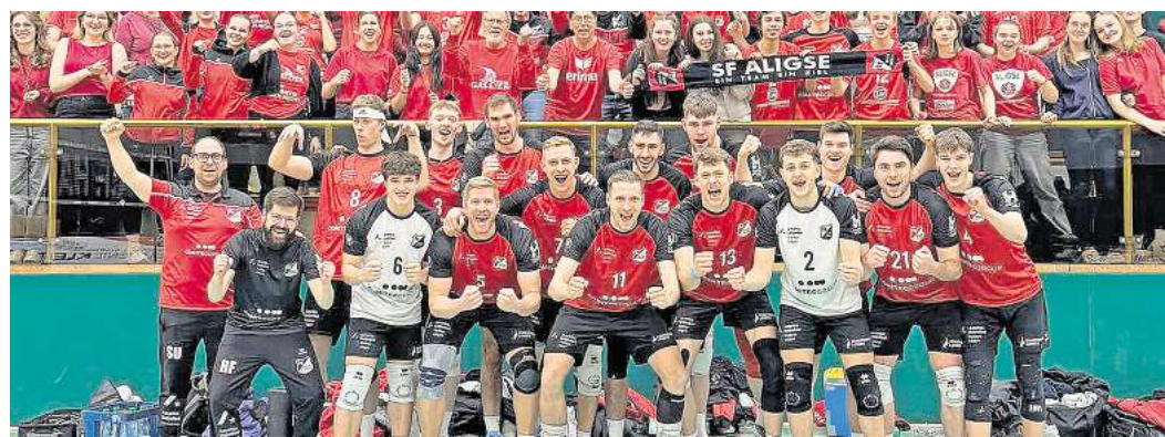
Mit "Roter Wand" siegt es sich leichter: Das Aligser Team hat viele Fans im Rücken.

Das Spiel wird am heutigen Sonnabend, 14. März, um 19 Uhr in der Universitätssporthalle Münster angepfiffen. Unter https://www.youtube.com/watch?v=WLVoswV6o8 kann die Begegnung im kostenlosen Livestream im youtube-Kanal von Dyn-Volleyball mitverfolgt werden, zudem informiert der Liveticker der Volleyball-Bundesliga (VBL) unter https://www.vbl-ticker.de über die Spielstände aus allen Hallen.