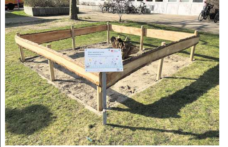
Für die Blütenpracht gebaut: Pflanzbeet am Rathaus.

Die Fläche wurde von den Auszubildenden inzwischen als Blühfläche hergerichtet und durch einen niedrigen Holzzaun umrandet.