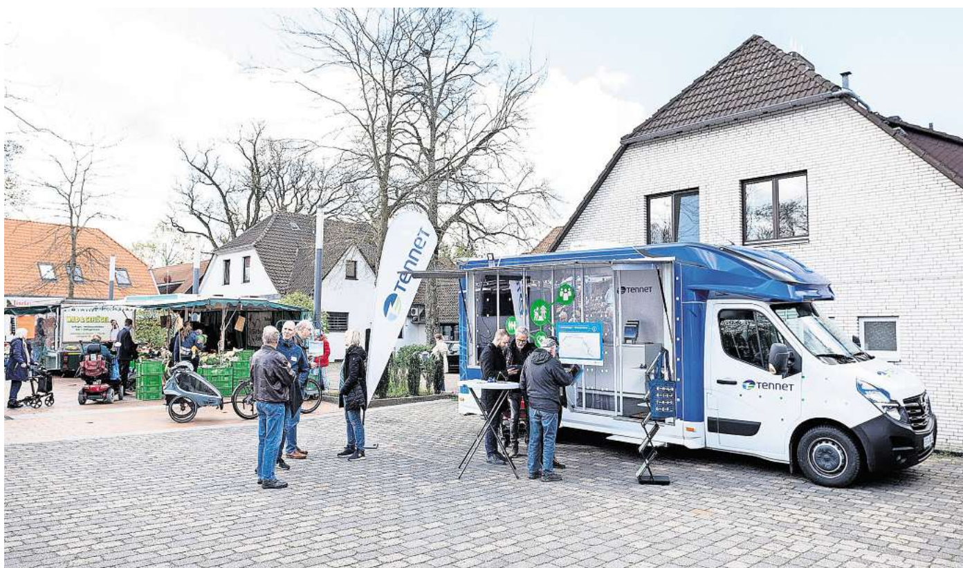
Infomobil mit Beratung unterwegs.