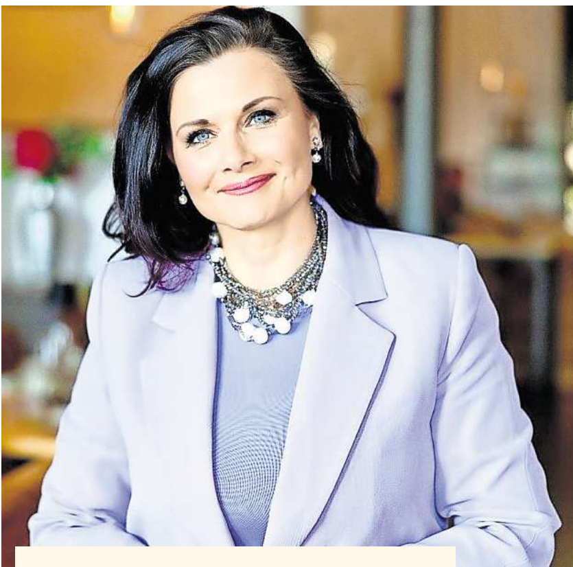
Gitta Connemann, Parlamentarische Staatssekretärin bei der Bundesministerin für Wirtschaft und Energie, Beauftragte der Bundesregierung für den Mittelstand sowie Bundesvorsitzende der MIT, ist in Sehnde zu Gast.

„Eine starke regionale Wirtschaft lebt von Vernetzung, gegenseitigem Verständnis und gemeinsamem Handeln. Der MIT-Stadtverband Sehnde wird hierfür eine verlässliche Plattform bieten