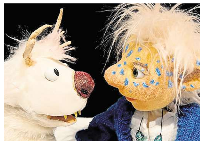
Das Figurentheater Buchfink zeigt „Lykke Eira“.