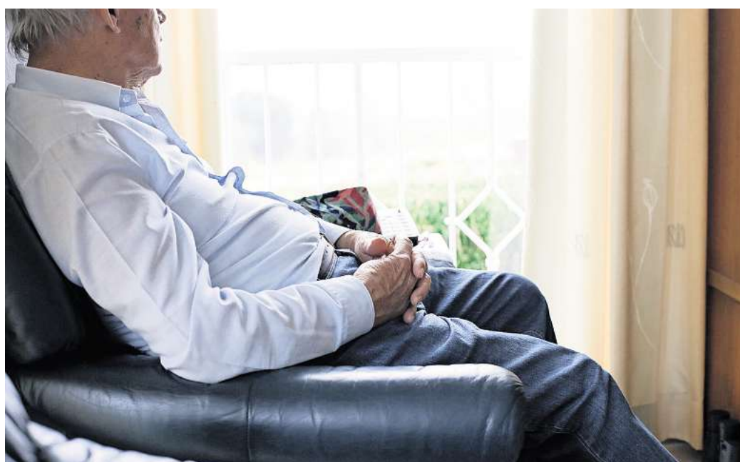
Einer Eigenbedarfskündigung kann bei unzumutbarer Härte durch den Mieter widersprochen werden - zum Beispiel bei fortgeschrittenem Alter.

Taucht die Wohnung auf Verkaufsportalen auf, ist der angemeldete Eigenbedarf mutmaßlich vorgetauscht. Gingen der Kündigung Streitigkeiten um Mieterhöhungen und Nebenkosten voraus, sollten Mieter ebenfalls misstrauisch werden, so Monika Schmid-Balzert.