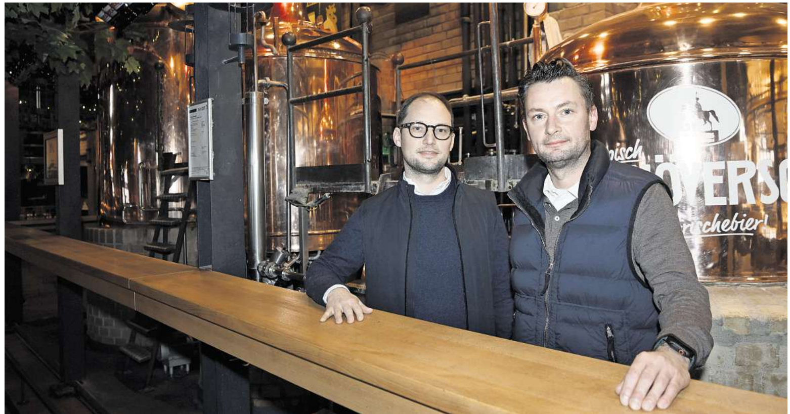
„Bei uns können drei Generationen an einem Tisch feiern.“