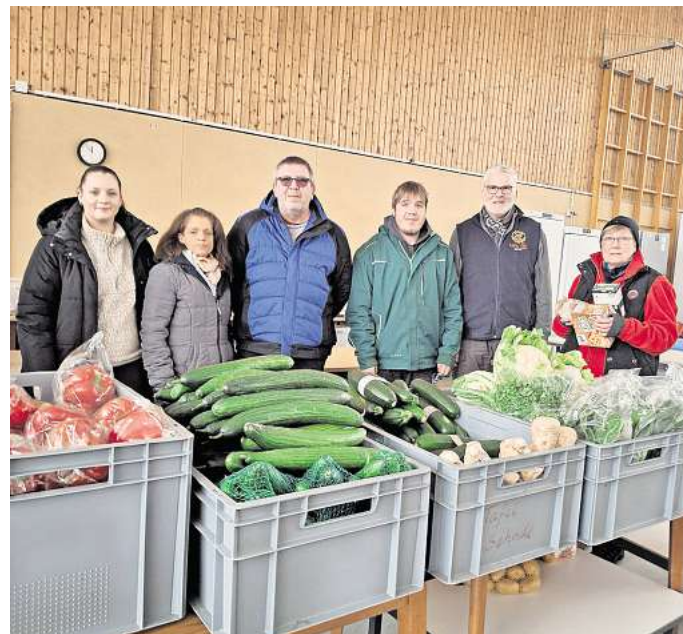
Das Tafel-Team im Wintermodus.

„Trotz aller Widrigkeiten sorgen die Mitarbeiter mit guter Laune und Zusammenhalt für eine warme, herzliche Atmosphäre. Und wenn einmal etwas nicht wie geplant funktioniert, weiß man sich zu helfen“, schreibt Hans-Jürgen Grethe. So sei der Parkplatz an einem Ausgabetag kaum nutzbar gewesen, weil der Schnee sehr hoch lag. Die Lösung des Problems: „Ein Tafel-Mitarbeiter rief einen Nachbarn an, der einen Trecker mit Schneepflug besitzt. Der hilfsbereite Nachbar kam, sah und half.“