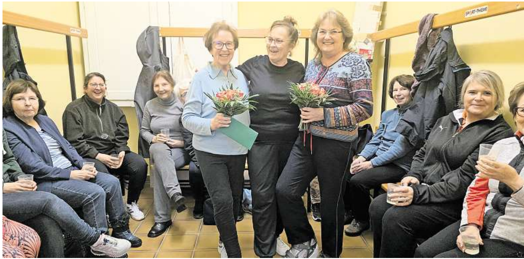
Die MTV-Abteilung Damenfitness bietet immer auch Geselliges.