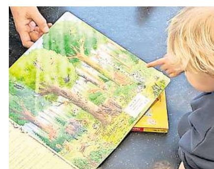
Lust aufs Lesen wecken: Bilderbücher für die Jüngsten.

Von 12 bis 14 Uhr können Kinder gemeinsam mit Blickwechsel e.V. ihre Lieblingsfiguren malen und als Animationsfilm zum Leben erwecken. Ergänzt wird das Programm durch fortlaufende Ausstellungen, Büchertische und Bastelangebote. Der Eintritt zum Bilderbuch-Sonntag ist frei. RHR