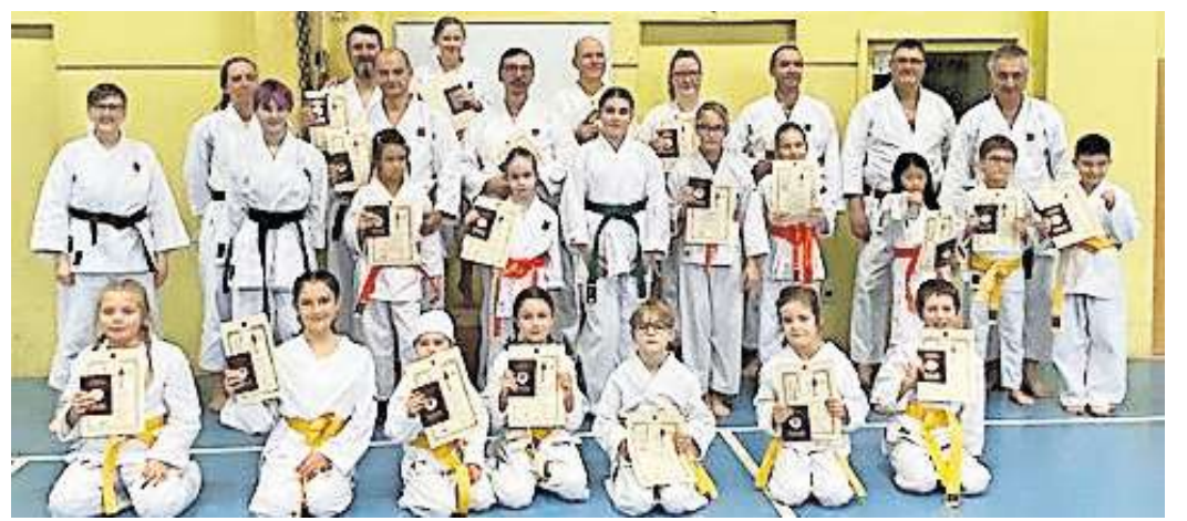
Verein „Karate Dojo Lehrte“: Erfolgreiche Teilnehmer der jeweiligen Gürtelprüfung.

Erwachsene an. Ganz neu ist der Kurs für Erwachsene im Alter über 50 Jahre. Beweglichkeit, Selbstverteidigung, Selbstsicherheit und die Gemeinschaft werden altersgerecht gefördert. Weitere Informationen finden Interessierte auf der Internetseite karate-dojo-lehrte.de.