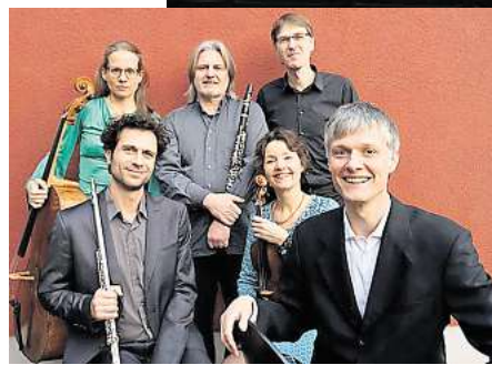
Das Neue Ensemble spielt sein „Neujahrskonzert à la Valentin“.

voller Improvisation, Funk und Humor. Zwischen Disco-Zitaten aus fünf Jahrzehnten und spontanen Gesangseinlagen entsteht eine mitreißende Silvestersause, die Generationen verbindet. Der Einlass beginnt um 20 Uhr, Tickets kosten im Vorverkauf 41,60 Euro, ermäßigt 35 Euro, an der Abendkasse 45 Euro beziehungsweise 40 Euro.