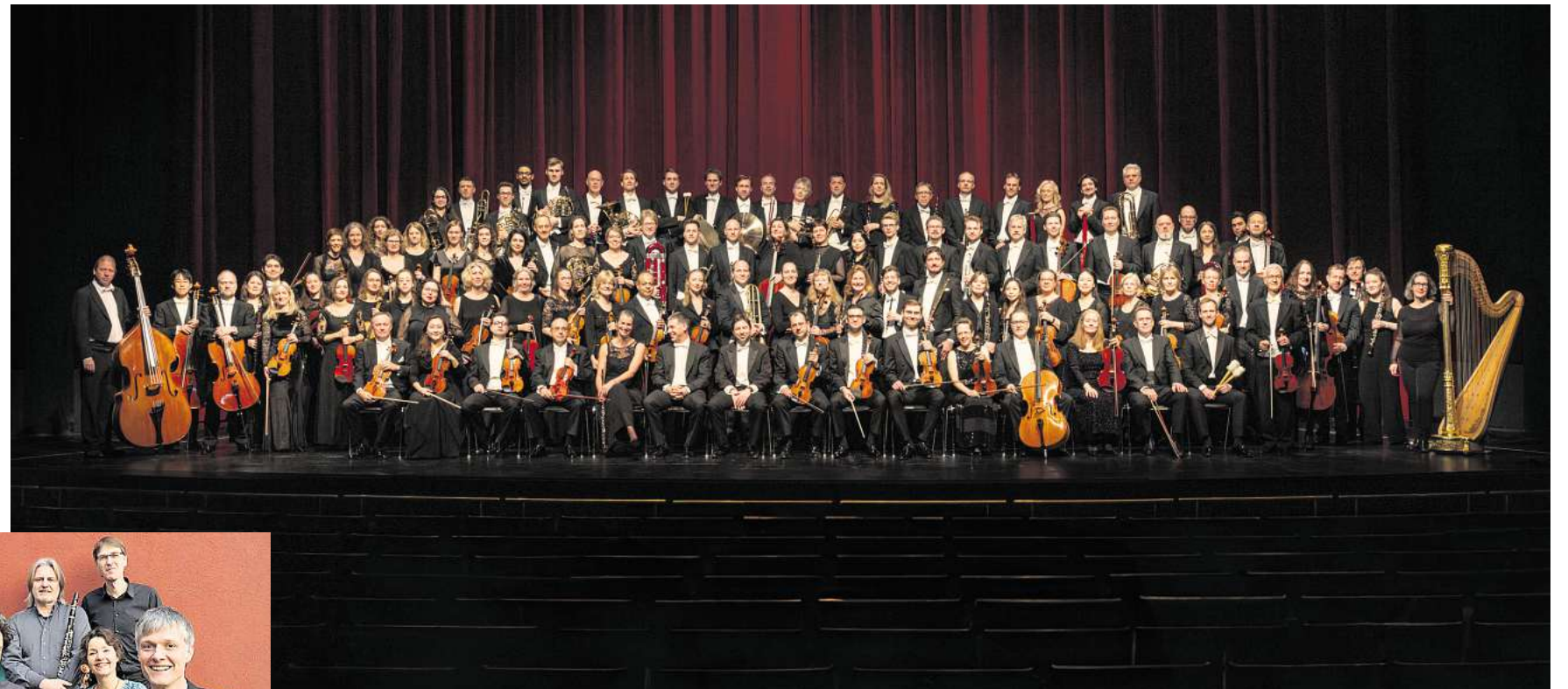
Das Niedersächsische Staatsorchester Hannover spielt gleich zwei Neujahrskonzerte am 1. Januar 2026: ab 12 Uhr und ab 19.30 Uhr.