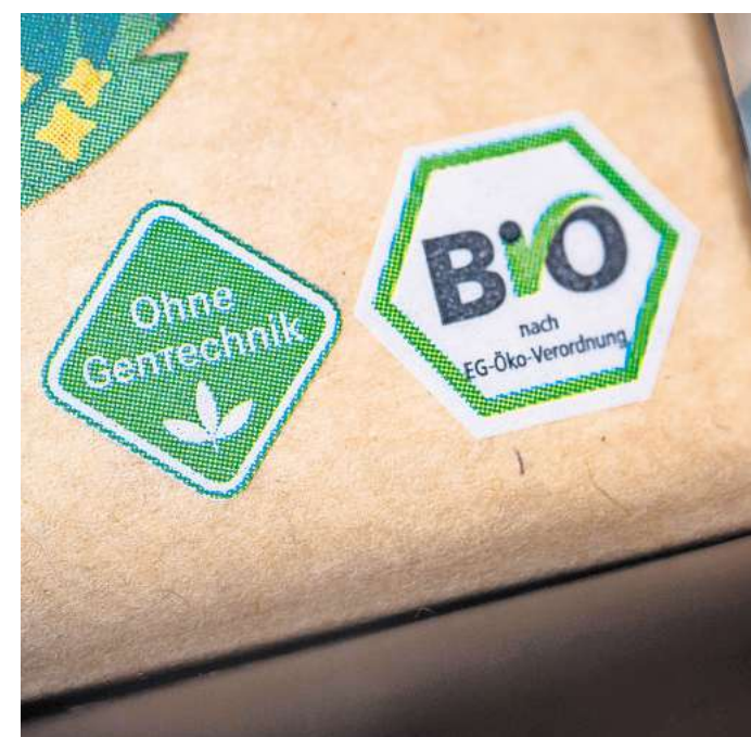
Das Siegel «Ohne Gentechnik» gibt es seit 2009; auch Bio-Lebensmittel müssen «ohne» sein.

• Haben verpackte Lebensmittel eine Zutatenliste, steht der Hinweis in dieser Liste hinter der entsprechenden Zutat oder als Fußnote in der gleichen Schriftgröße. Gibt es keine Zutatenliste auf der Verpackung, etwa bei Polenta aus Maismehl, steht der Hinweis auf dem Etikett. • Bei unverpackten Lebensmitteln, zum Beispiel Maiskolben, muss der Hinweis am Lebensmittel selbst auf einem Schild oder auf einem Aushang daneben stehen. • Bei Lebensmitteln in Verpackungen mit weniger als zehn Quadratzentimetern Oberfläche, etwa Eiskonfekt, befindet sich der Hinweis dauerhaft lesbar auf der Verpackung. Die Her-