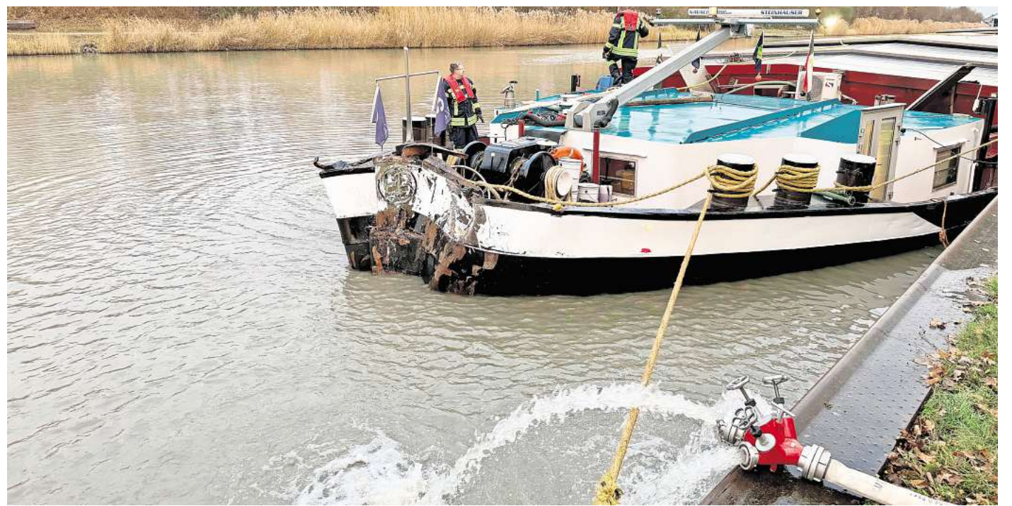
Binnenschiff mit Schräglage an der Liegestelle Sehnde Süd.

Gegen 15.45 Uhr wurden die Tauchergruppen aus Lehrte und Burgdorf sowie die Ortsfeuerwehr Bolzum zur Unterstützung nachalarmiert. Diese brachte eine zweite Tragkraftspritze in