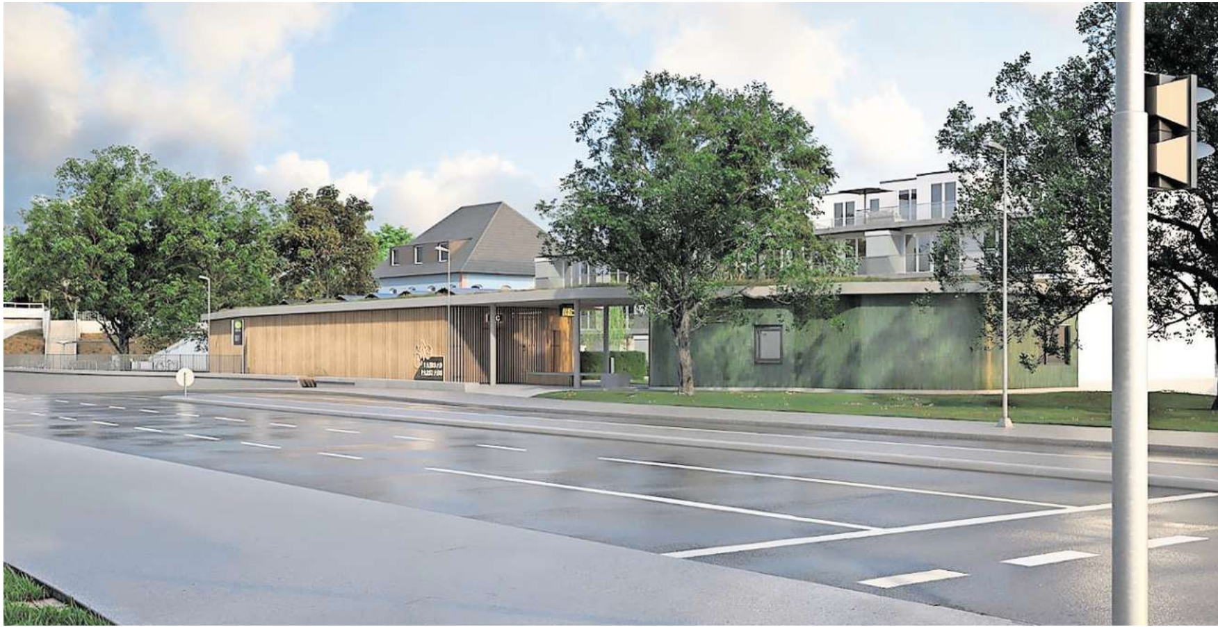
Bis auf Möblierung und Beschilderung ist der Plan für das Fahrradparkhaus fix. Hier in der Perspektive aus dem Kreuzungsbereich Nordstraße und Peiner Straße mit Blick in Richtung Bahnhof. Foto: Michelmann-Architekten

Architekten-Entwurf zeigt zukünftige Optik, Investitionssumme mehr als eine Million Euro