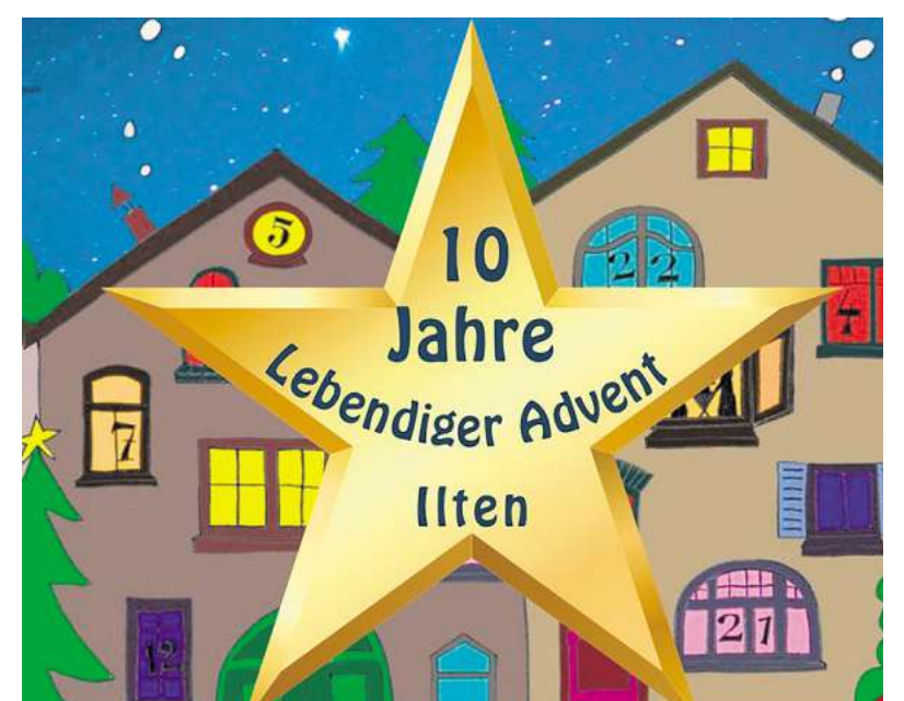
Das Jubiläums-Logo des Iltener „Lebendigen Advents“ ziert die neue Trinkbecher-Edition.