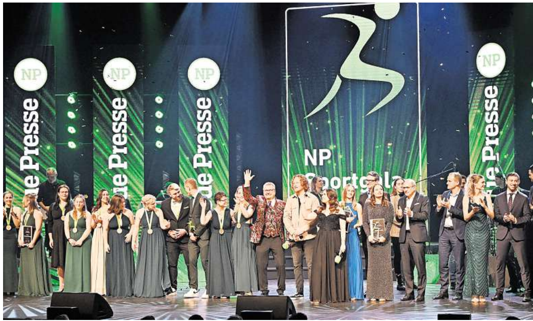
Abschluss der NP-Sportgala in diesem Jahr.