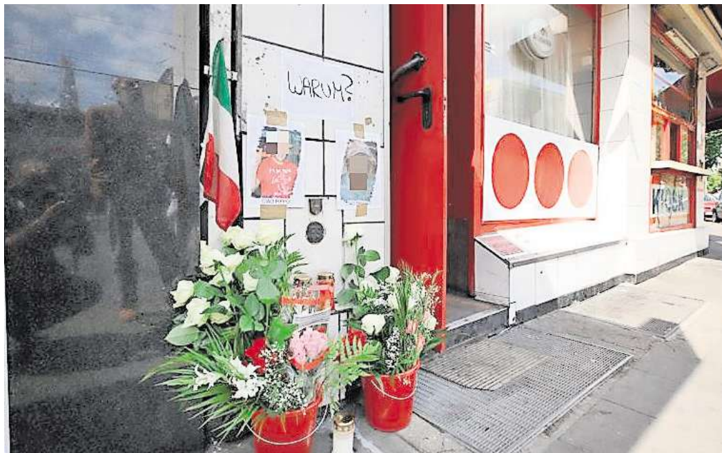
Tatort Steintor-Viertel: 2010 wurden die beiden Italiener Guisepppe L. und Francesco S. in der Columbus-Bar erschossen. Der Erfolgspodcast True Crime Hannover befasst sich in der Folge „Drei Schüsse für vier Sterne – Mord in der Columbus-Bar“ mit dem kaltblütigen Verbrechen.

Die Folge „Drei Schüsse für vier Sterne – Mord in der Columbus-Bar“ ist zu finden in der NP-App, unter www.neuepresse.de und überall dort, wo es Podcasts gibt – beispielsweise bei Spotify, Amazon oder Audible.