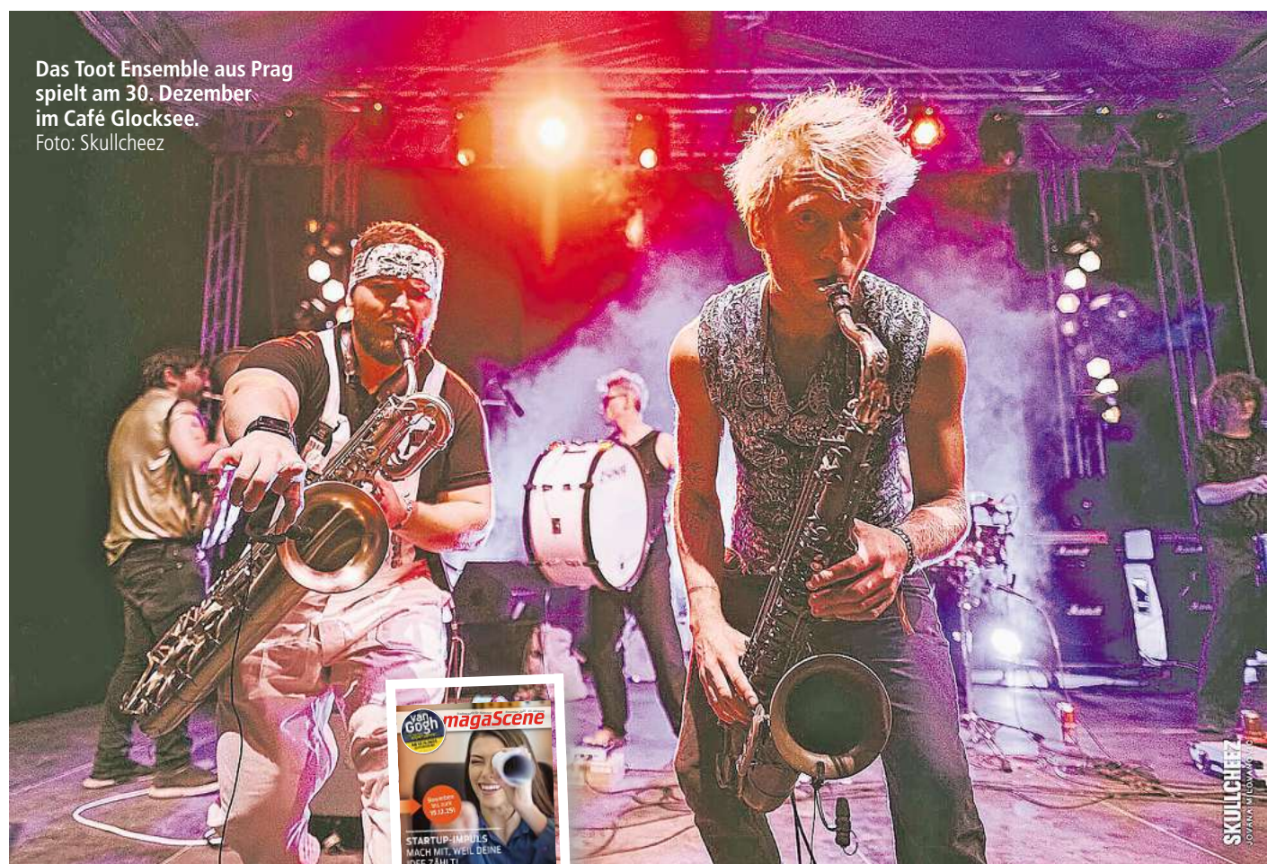
Das Toot Ensemble aus Prag spielt am 30. Dezember im Café Glocksee.

Zum krönenden Abschluss des Festivals tritt dann endlich Königliche Braut auf. In strammem Blau, mit Promille und Hackfahne, rempelt sich Königliche Braut per Bleifuß dauerhupend durch den Melodien-Traffic, um die Liebe zu preisen. Das klingt doch nach