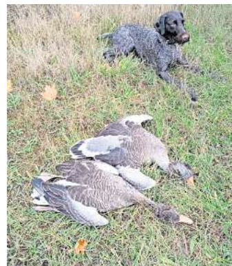
Hygienemaßnahme, Kadaver geborgen: Jagdhund Bessi hat auf Weisung des Hegeringleiters gearbeitet.

Die Region Hannover ruft Geflügelhalter zu vermehrter Wachsamkeit und Einhaltung mindestens folgender Biosicherheitsmaßnahmen auf: Wechseln des Schuhwerks (Stallschuhe nur für den Stall), Anlegen von Schutzkleidung über der Alltagskleidung, Händewaschen vor Betreten der Geflügelhal-