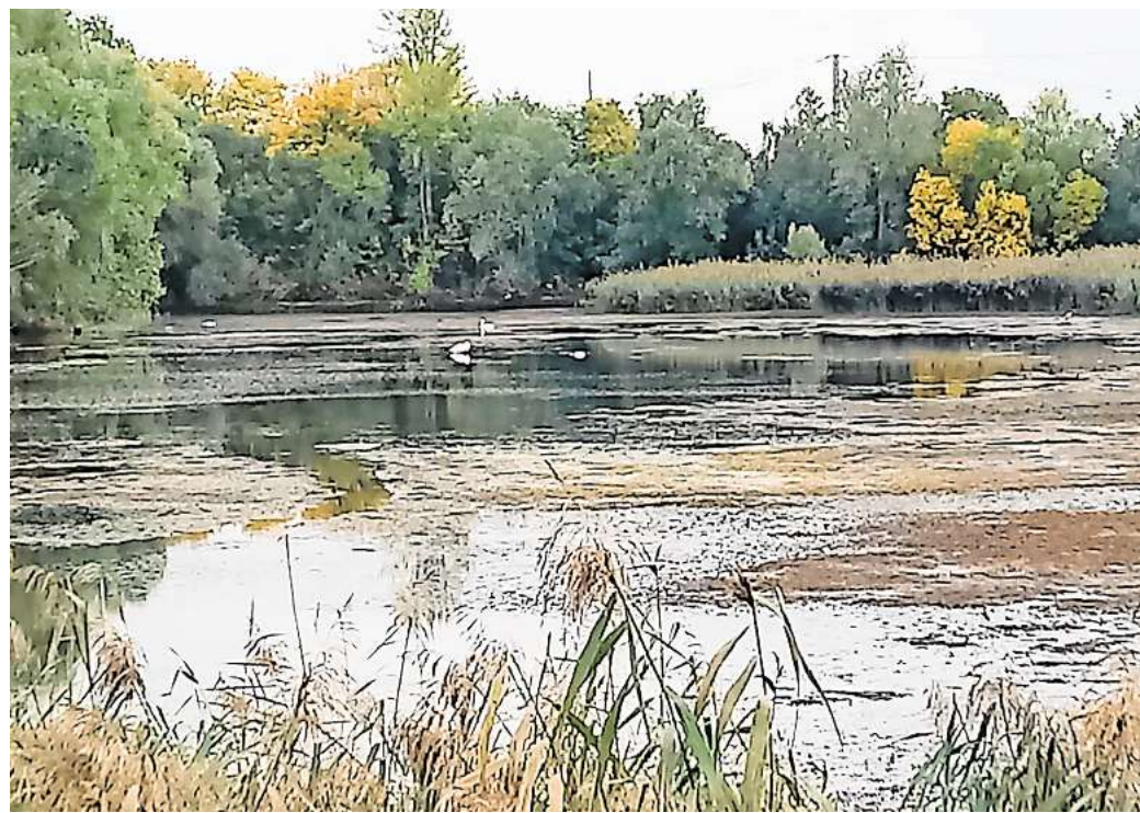
Zuckerfabriksteich: Vier verendete und zwei lebende Schwäne.