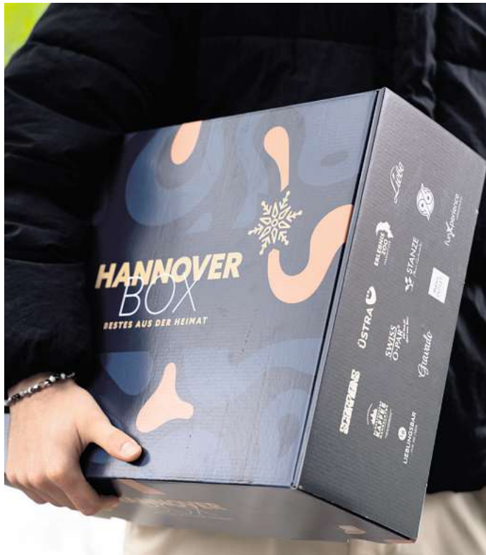
Hannovers Vielfalt im Paket: Die Hannover-Box.