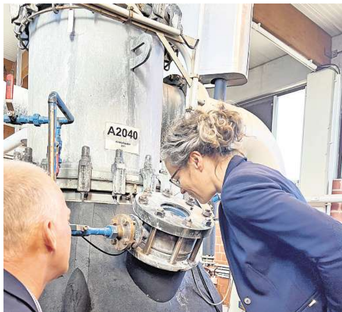
CFL-Produktionsprozesse werden deutlich.

Luft und Wasser werden für die Produktion gefiltert, angelieferte Rohstoffe wie Salzlösungen und produzierte Waren wie beispielsweise Bittersalze werden mehrfach geprüft und nur einwandfreie Ware verlässt die Fabrik.