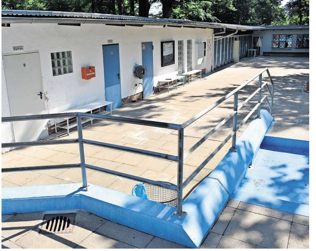
Bleibt vorerst dicht: Ein Rohrbruch im Pumpenkeller hat das Waldbad in Arpke lahmgelegt.