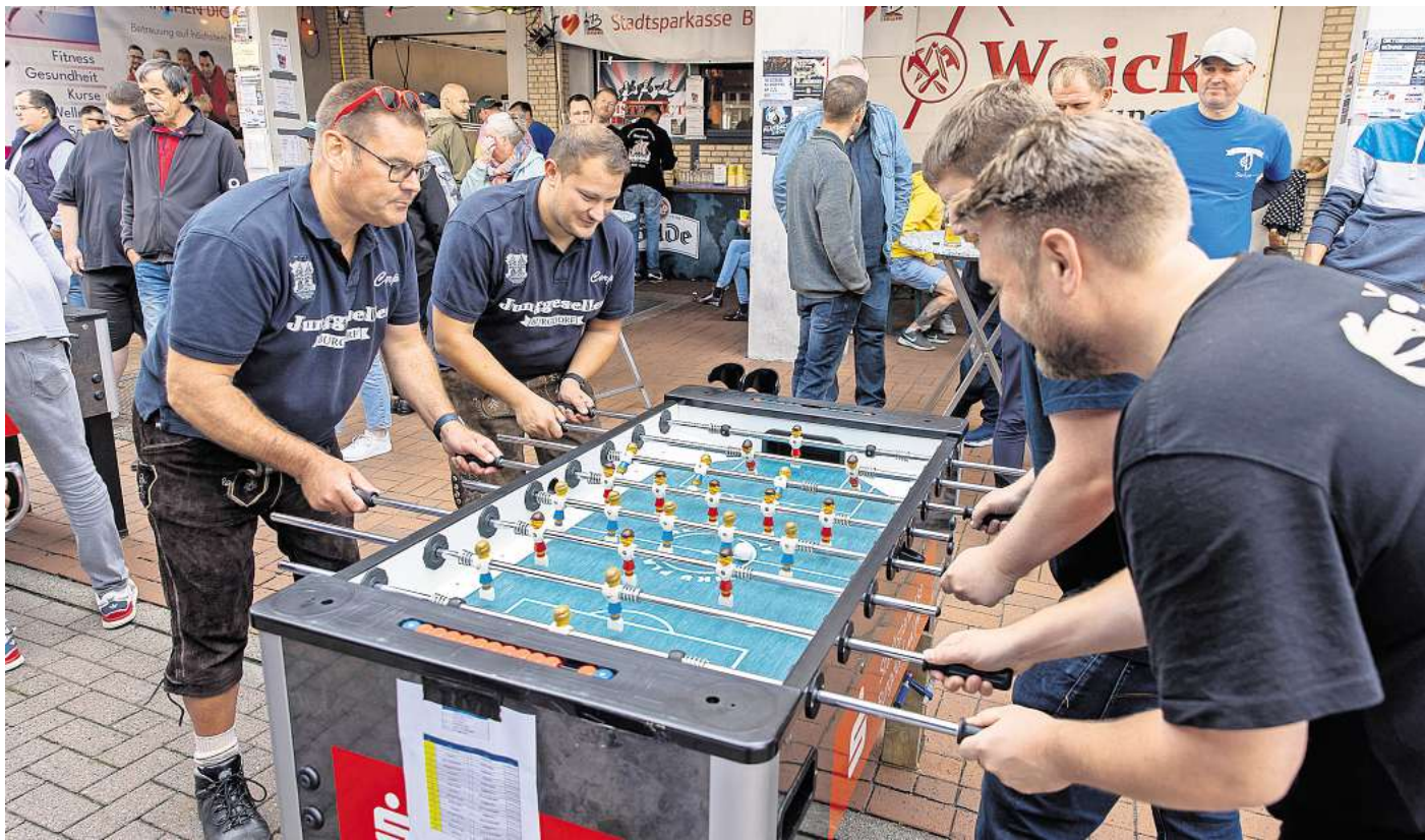
Am Sonabend wird an der Junggesellen-Bühne die Burgdorfer Kicker-Meisterschaft ausgetragen.