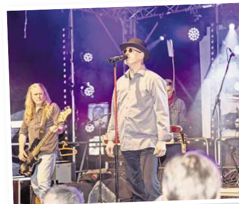
Die Coverband „Mit 18“ bringt Hits von Marius Müller-Westernhagen auf die Bühne.