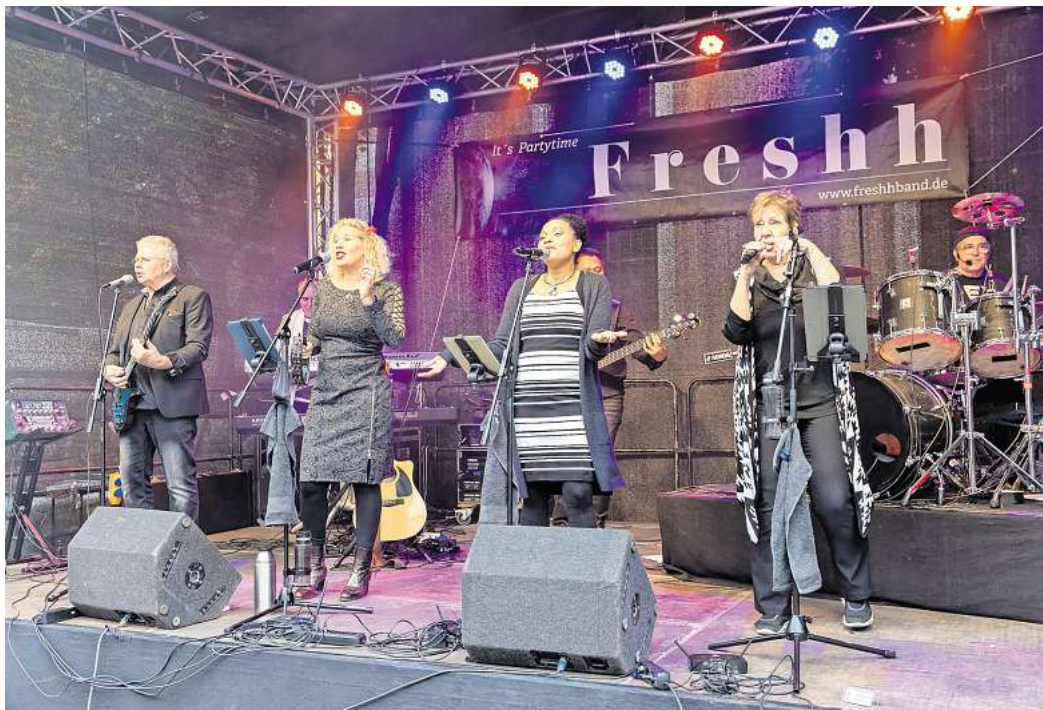
Die Partyband „Freshh“ sorgt für gute Stimmung.