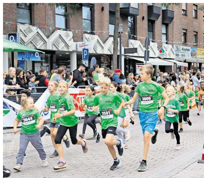
Im Team entwickelt sich der Wettkampfgeist.