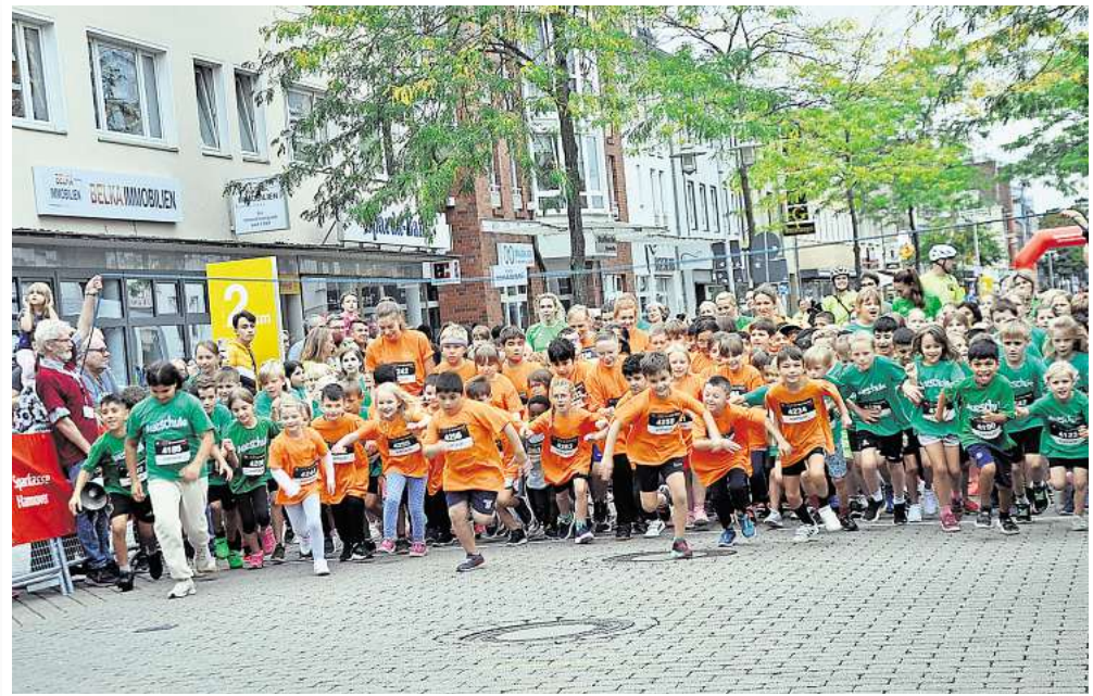
Hochmotiviert: Von den Lehrter Grundschulen starten 1134 Kinder.