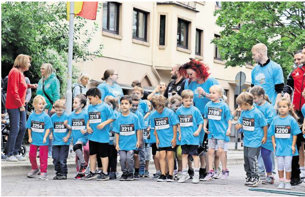
Für jedes Alter geeignet: Teilnehmer vor dem Start.