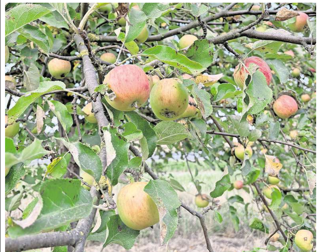
Obst an den Straßenbäumen der Stadt Sehnde darf geerntet werden.

Mengenbegrenzung, nur für den privaten Gebrauch