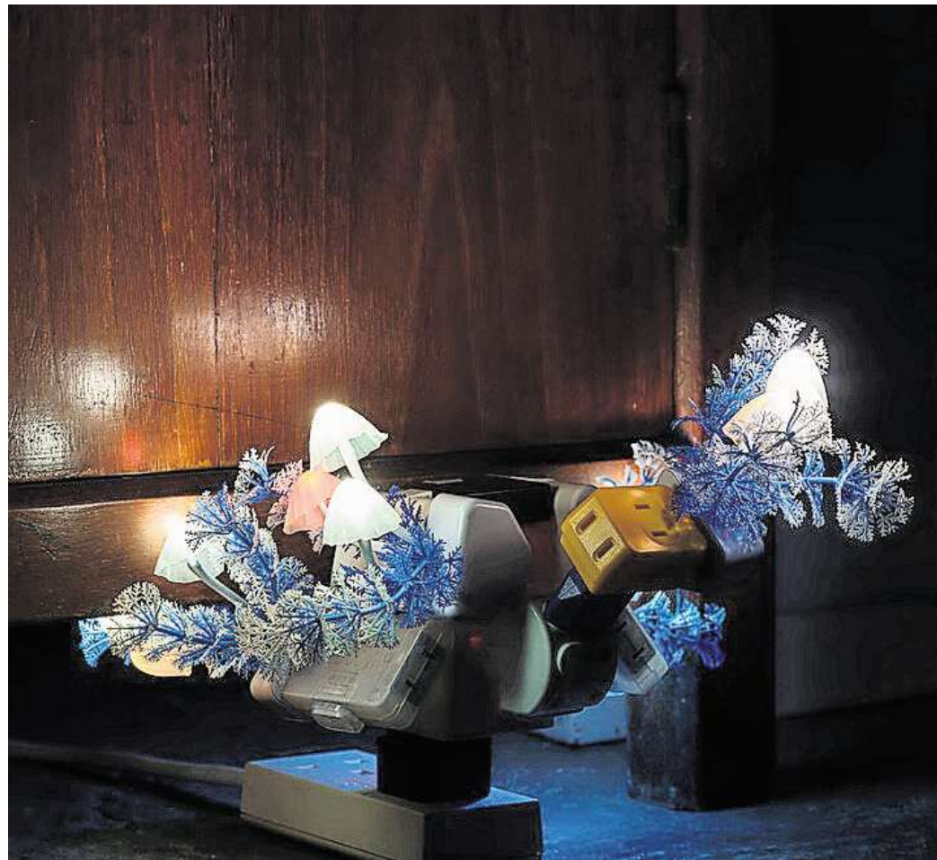
Trevor Yeung: Night Mushroom in shade (Teak Cabinet), 2024, im Auftrag von M+, 2024.

Ausgehend von seinem Wissen über Botanik und aquatische Ökosysteme entwickelt Yeung komplexe Arrangements, in denen pflanzliches Wachstum mit sozialen Dynamiken in Bezie-