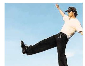
Live dabei: Lönneberger mit sommerlichem Indie-Pop.

dabei sind, ihren Platz in dieser Welt zu finden. Kunstloses Brot spicken ab 19.15 Uhr Art-Pop mit lebensnaher Lyrik. Mit einer Show, die gleichzeitig Performance, DJ-Set und Konzert ist, spannen Chris Croissant und Ben Brioche den perfekten Bogen zwischen Kunst und Unterhaltung. Den Abschluss macht ab 20.45 Uhr Lönneberger. Der gebürtige Hamburger Michel Pabst liefert den Soundtrack für warme Sommerabende – mit Elektro-angehauchten Indiepop-Beats und deutschen Texten, die das Jungsein verkörpern. Der Eintritt ist frei. RED