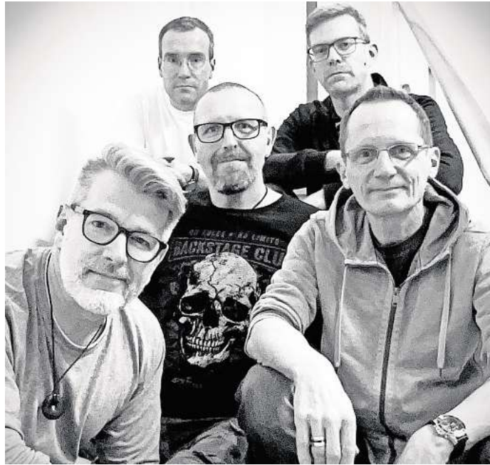
Die Band "Tuesday at Six" ist im Biergarten in Ahlten zu hören.

Rock Cover-Band „Tuesday at six“ spielt im Biergarten