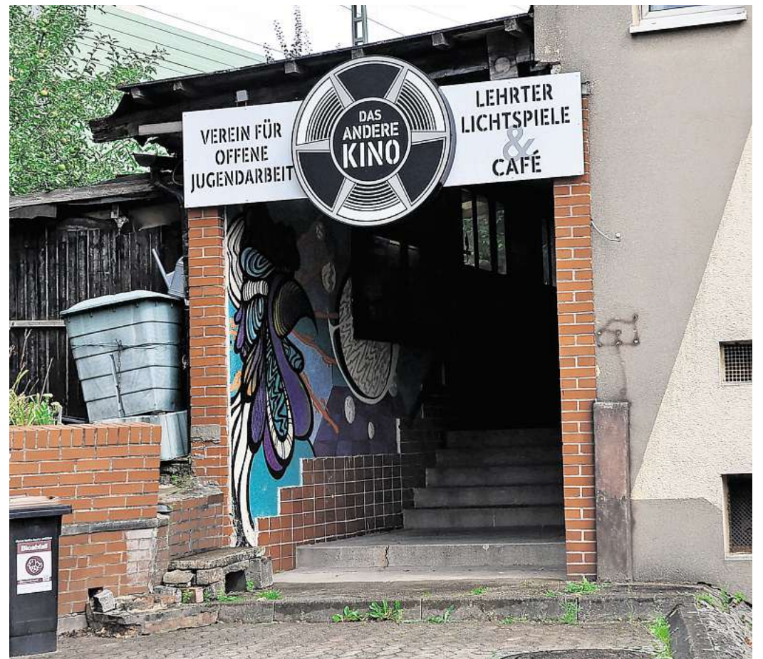
Umbaupause: Das Andere Kino bleibt bis zum 21. August geschlossen.

Jetzt werden im Kassenhaus die Wände erneuert, der kleine Raum bekommt zudem neue Wandregale. „Das Auto ist voll mit Bauschutt – den fahren wir gleich zum Bauhof in Sehnde“, kündigt Laudage an. In den nächsten Tagen soll zudem noch die Theke frisch gestrichen werden.