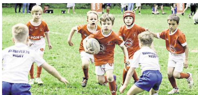
Die VfR-Jugend in Aktion.