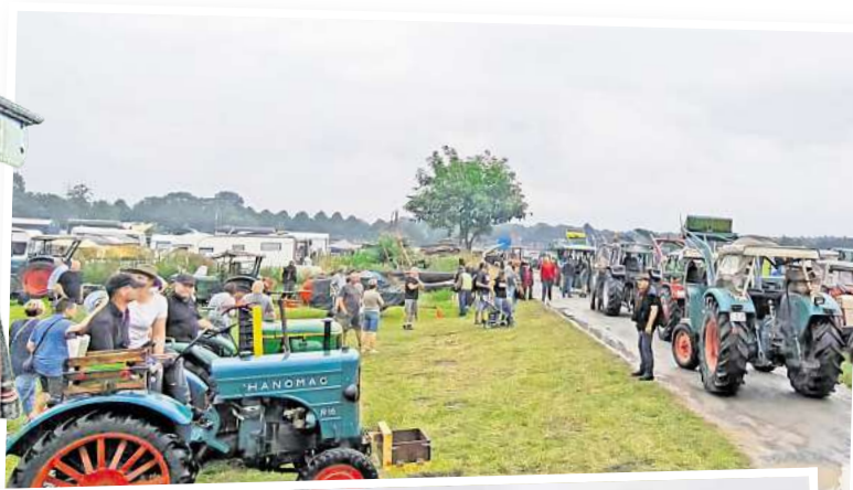
Dampfmaschinen und Trecker sind in beachtlicher Vielfalt in der Ausstellung zu sehen.