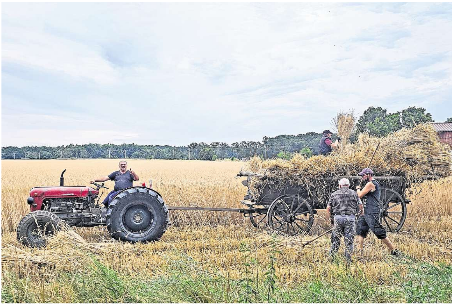
Rechtzeitig vor dem Dreschefest wurde bereits gemäht.

AUSSTELLUNG UND PROGRAMM AM 16. UND 17. AUGUST