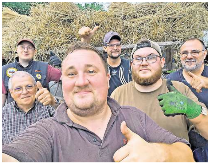
Engagiert im Verein „Freunde historischer Fahrzeuge“: Die Mähmannschaft.

Viele Traktoren und Geräte gibt es zu sehen, einige Dampftraktoren mit Anhänger laden die Kinder zum Mitfahren ein. Zum Austoben steht eine Strohburg bereit. Der kleine Teile- und Werkzeugmarkt sowie der Kunsthandwerkermarkt ergänzen das Angebot. Gemütlicher Klönschnack bei