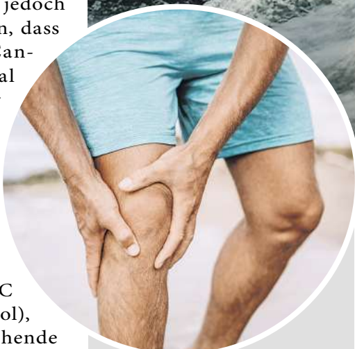
Müde und beanspruchte Muskeln? Viele vertrauen dabei auf Rubaxx Cannabis CBD Gel.

Der älteste Hanf-Fund in Europa liegt in Deutschland und wird auf 5500 v. Chr. datiert. Damals war jedoch noch nicht zu erahnen, dass insbesondere der Cannabisstoff CBD einmal einen Siegeszug in der Wissenschaft antreten würde. Heute ist ein regelrechter CBD-Boom ausgebrochen. Kein Wunder, denn anders als der ebenfalls bekannte Cannabisstoff THC (Tetrahydrocannabinol), der für die berauschende Wirkung der Cannabisdroge verantwortlich ist, macht CBD weder „high“ noch abhängig. Sogar die WHO (Weltgesundheitsorganisation) stuft CBD als sichere Substanz mit einem geringen Risiko ein. 1 Zahlreiche Studiendaten deuten bereits darauf hin, dass CBD