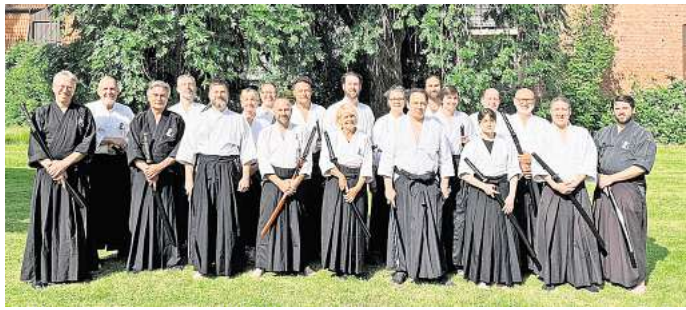
Aiki-Dojo Sehnde: Teilnehmer des Workshops in Duderstadt.

Workshop der Kyushin Iaidokas in Duderstadt