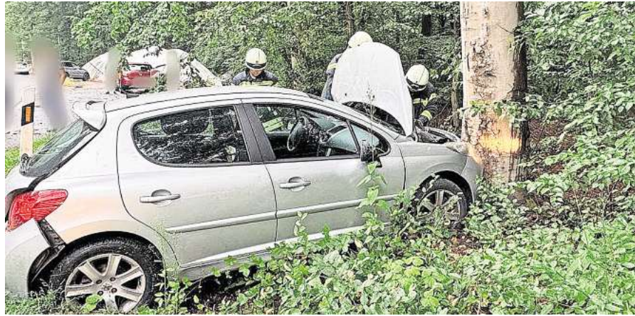
Unfallschaden auf der K148 am 12. Juli.

kamera und trennte vorsorglich die Fahrzeugbatterie vom Stromkreis. Nach Abschluss der Maßnahmen konnten die ehrenamtlichen Kräfte wieder einrücken. Die verletzte Frau wurde vom Rettungsdienst zur weiteren Behandlung in ein Krankenhaus gebracht. Im Einsatz waren die Ortsfeuerwehr Müllingen-Wirringen sowie der Rettungsdienst.