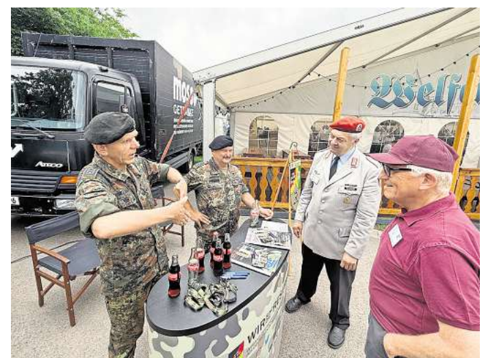
Informationsstand der Bundeswehr auf dem Schützenplatz in Ilten.

Zum Hintergrund: Mit großer Mehrheit hatte der Bundestag im Jahr 2024 die Einführung eines Veteranentags am 15. Juni beschlossen. An diesem Tag sollen Soldaten der Bundeswehr geehrt werden und Aufmerksamkeit geschaffen werden für die Leistung von Veteranen für Frieden, Freiheit und Demokratie.