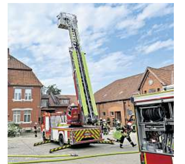
Aufbau der Drehleiter während der Übung.

Zeitgleich wurde die Löschwasserversorgung aufgebaut. Hierfür standen mehrere Hydranten im Umfeld zur Verfügung. Die Versorgung konnte zügig und ohne Komplikationen sichergestellt werden, so-