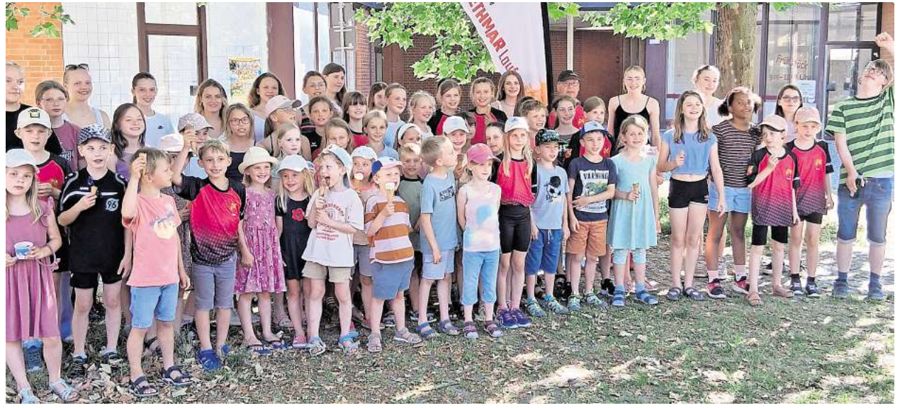
Sommerliches beim MTV: Die Laufkinder treffen sich an der Eisdiele.

Wie schon im letzten Jahr, machte leider auch in diesem Jahr die Wettervorhersage, für diese immer gut ankommende Kinderaktion, einen Strich durch die Rechnung. Denn hatte es im Vorjahr an diesem Nachmittag geregnet, war es in diesem Jahr genau anders herum. Laut Wettervorhersage waren Temperaturen um die 36 Grad plus angesagt. Da die geplante Fahrstrecke wieder auf dem Kanallängsweg am Mittel-