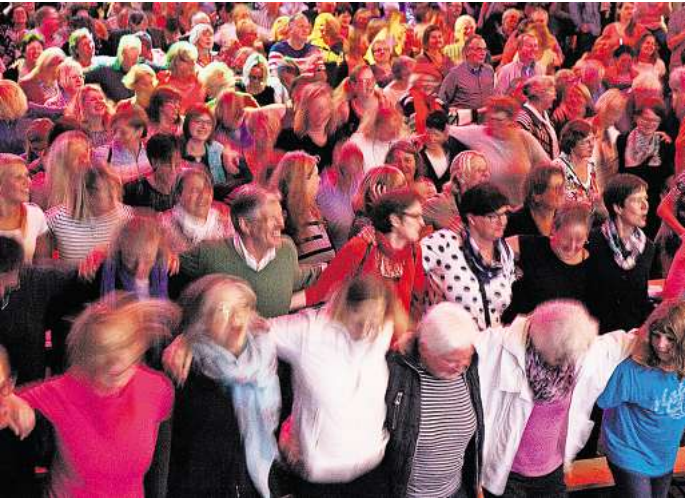
Das "Rudelsingen" sorgt für gute Stimmung.

sein Abitur gemacht. Eintrittskarten gibt es auf der Internetseite www.rudelsingen.de .