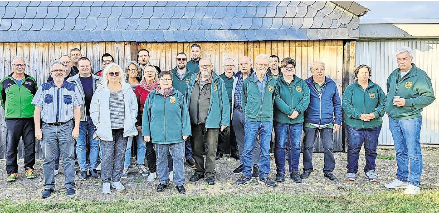
Die Lehrter Bürgerschützen freuen sich über ihre Erfolge bei den Kreismeisterschaften.

Lehrter Verein hat bei den Kreismeisterschaften das größte Team gestellt