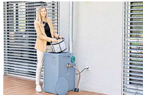
Eine kompakte Funktionsbox reinigt das Regenwasser vom Dach und pumpt es zu einem Tank oder einer Zisterne. Diese kann auch weiter entfernt vom Haus platziert werden.

Sinkende Grundwasserstände auf der einen Seite, kurze, umso heftigere Starkregenfälle auf der anderen: Auch in Deutschland sind wir mit Veränderungen der Niederschläge und abnehmenden Wasserressourcen konfrontiert. Hausbesitzer können diesen Entwicklungen in ihrem persönlichen Umfeld etwas entgegensetzen, indem sie das Regenwasser nicht in die Kanalisation ableiten, son-