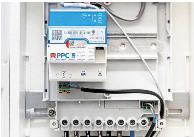
Smart Meter ermitteln den Stromverbrauch und können die erhobenen Daten direkt etwa an den Stromversorger oder den Netzbetreiber versenden.

Wichtig zu wissen für Wohnungseigentümergeinschaften: Der Zählerschrank gehört zum Gemeinschaftseigentum.