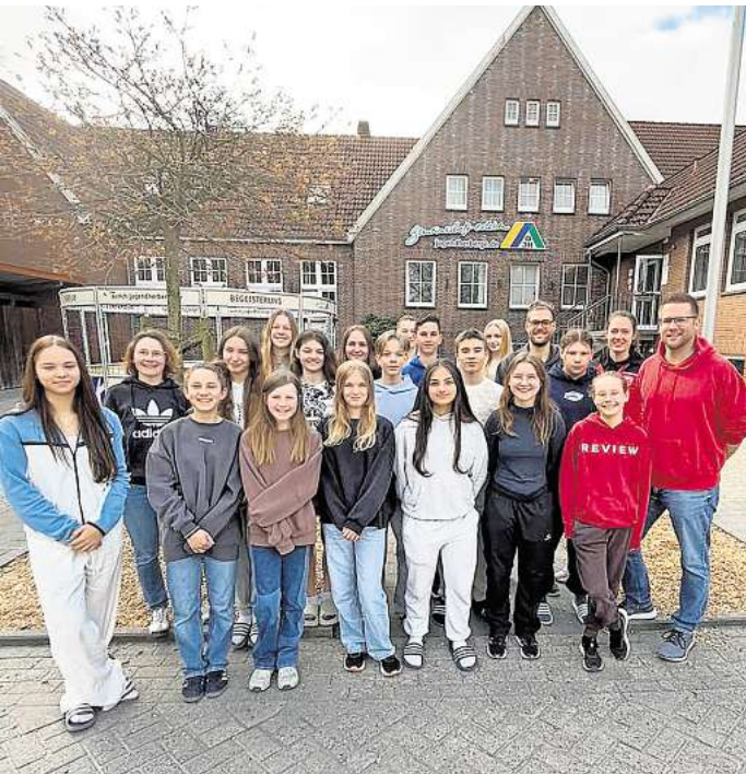
Saisonvorbereitung: TVE-Jugend im Trainingslager.

SEHNDE. Mit Rückenwind von der Nordsee und reichlich Sonnenschein im Gepäck hat die Leichtathletik-Abteilung des TVE Sehnde ein intensives Trainingslager im ostfriesischen Aurich absolviert. Vom 4. bis 8. April feilten 17 Jugendliche der Altersklassen U14 bis U18 unter der Anleitung von vier engagierten Betreuer an Technik, Ausdauer und Teamgeist – als konzentrierte Vorbereitung auf die bevorstehende Sommersaison. Das Programm war fordernd: Zwei Trainingseinheiten pro Tag verlangten den Nachwuchssportlerinnen sowohl körperlich als auch