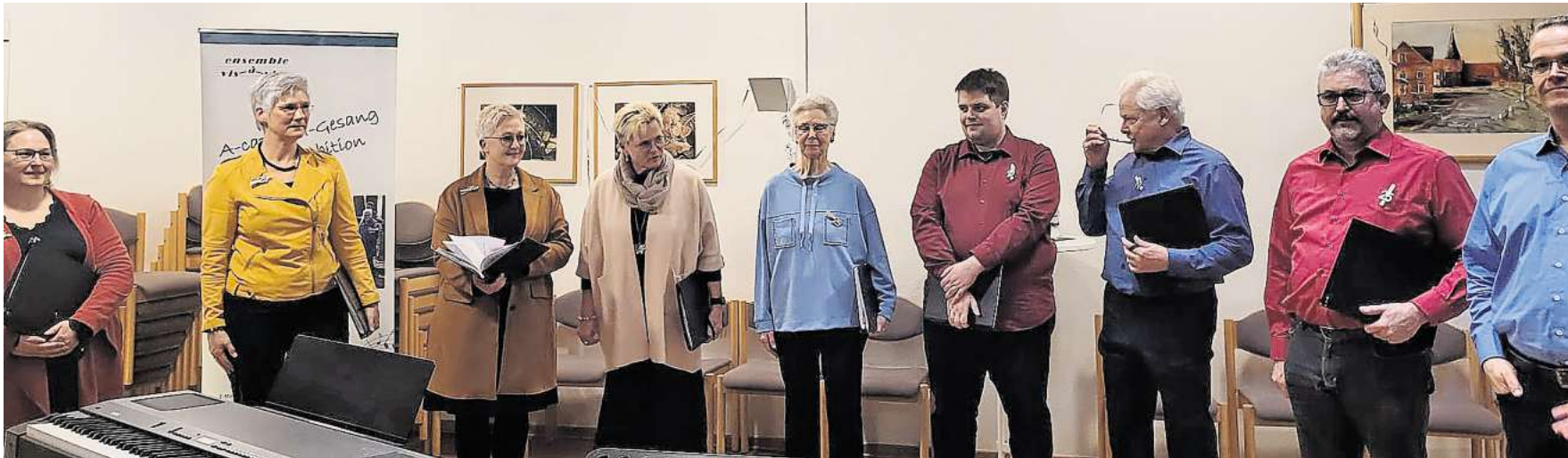
Das „ensemble vis-à-vis“ im Jubiläumsjahr.

„ensemble vis-à-vis“ singt mit „Young Voices“ im Fachwerkhaus