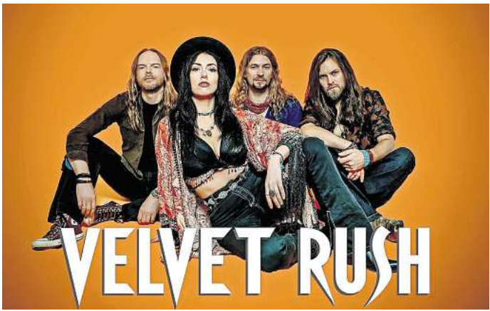
Im Programm der „Lehrter Rocknacht“: Velvet Rush.