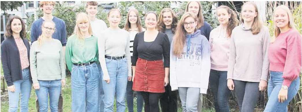
„Young Voices“ aus Aligse.

Die nächste Jubiläumsveranstaltung wird zugleich eine Premiere sein, denn das „ensemble vis-à-vis“ hat für das „1. Lehrter Rudelsingen“ gesorgt, das am 20. Juni im Kurt-Hirschfeld-Forum stattfindet. Der Ticket-Vorverkauf hat begonnen: E-Mail vorstand@doppelterz.de . Im Herbst schließlich werden sechs Lehrter Chöre gemeinsam mit und für das „ensemble vis-à-vis“ ein großes Abschlusskonzert am selben Ort gestalten. Weitere Informationen unter www.doppelterz.de , dort kann man sich auch zum Mitsingen im Ensemble melden.