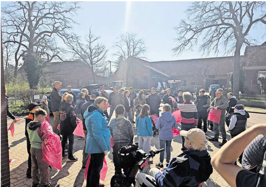
Große Beteiligung der Anwohner gab es bei de Müllsammlung in Wassel.

Das Fazit: „Die Müllsammelaktion war ein voller Erfolg und ein wunderbares Beispiel dafür,