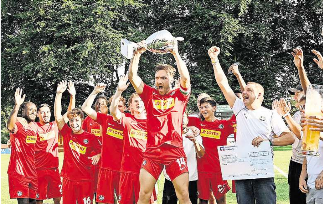
Das Team vom HSC Hannover feiert seinen Sieg beim Gilde Cup 2024 und freut sich über den Pokal und ein großes Glas mit drei Litern Gilde-Bier.

Breiten- als auch im Leistungssport und fördert mit einer Vielzahl von Programmen die Entwicklung von Nachwuchstalenten.