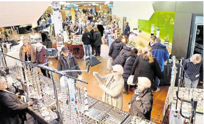
Vielfalt zeichnet die Kunsttage Sehnde aus.